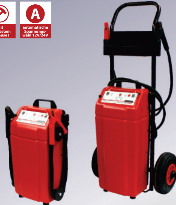
1024 SK (Fahrgestell optional)