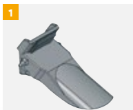
Numéro d'article G800A131