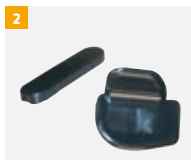
Numéro d'article G800A132