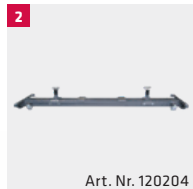
Art. Nr. 120204