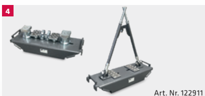
Art. Nr. 122911