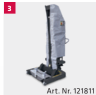
Art. Nr. 121811