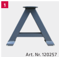
Art. Nr. 120257