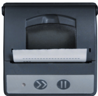
Drucker Artikelnummer ACKS010 (optional verfügbar)