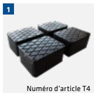
Numéro d'article T4