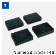
Numéro d'article T4B