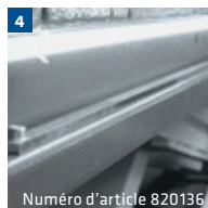
Numéro d'article 820136