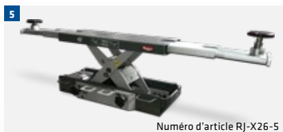
Numéro d'article RJ-X26-5