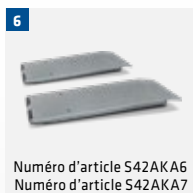
Numéro d'article S42AKA6 Numéro d'article S42AKA7