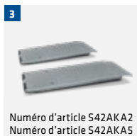
Numéro d'article S42AKA2 Numéro d'article S42AKA5